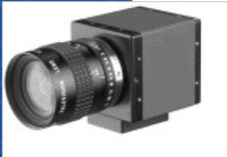
Lieferung ohne Objektiv