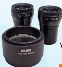
Okulare und Vorsatzoptik

... und zwar immer in hervorragender Bildqualität. Egal für welches DOKU-KIT (HDMI oder USB 3.0) Sie sich entscheiden, das Bild wird in FULL HD mit 1920x1080 Pixeln und mit mindestens 50 Hz dargestellt. Ruckelfrei und ohne sichtbare Verzögerungen.