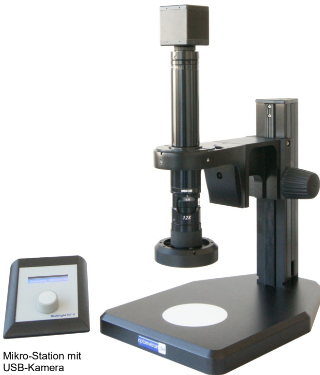
Mikro-Station mit USB-Kamera ST-300 Controller NT-II

Zur Basisversion gehören außerdem ein robustes Stativ und eine segmentweise schaltbare LED-Ringbeleuchtung.