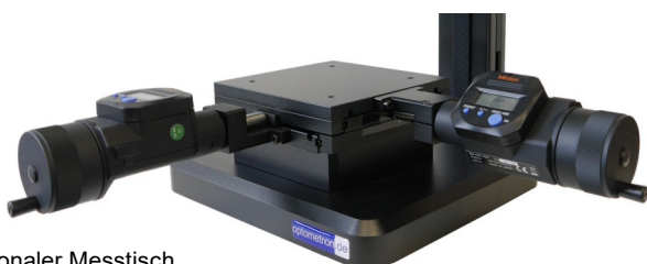
Optionaler Messtisch 50x50 mm mit digitalen Maßstäben