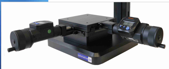
Optionaler Messtisch 50x50 mm mit digitalen Maßstäben (Auflösung 1,0 Mikrometer)