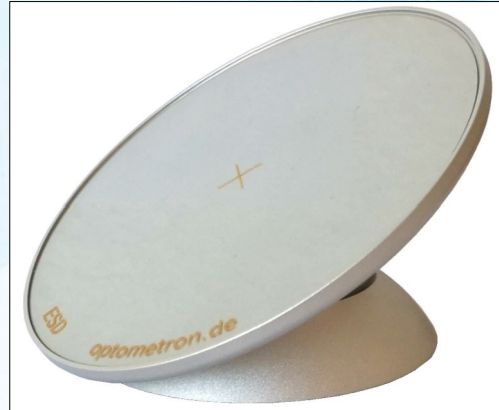
KT-100 mit ESD- Folie

Bei vielen mikroskopischen Untersuchungen hilft es, den Prüfling unter der Optik zu drehen und zu kippen. Zur optimalen Positionierung Ihres Prüflings haben wir den Kugeltisch neu entwickelt.