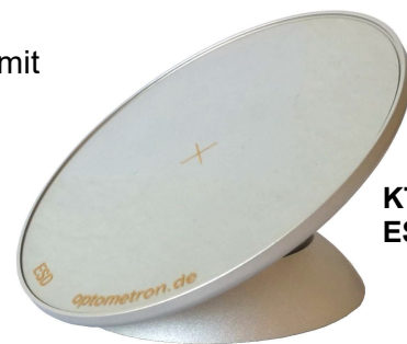
KT-100 mit ESD- Folie